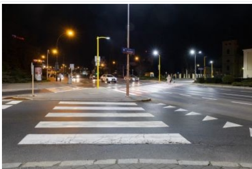
zdjęcie przedstawiające przejście dla pieszych na al. Cieplińskiego