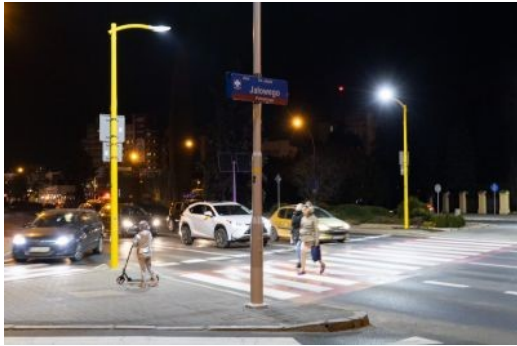
zdjęcie przedstawiające przejście dla pieszych na al. Cieplińskiego

Przejście dla pieszych na al. Cieplińskiego doświetlone. Nowoczesne rozwiązanie.