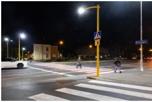
zdjęcie przedstawiające przejście dla pieszych na al. Ciepłińskiego